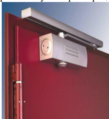
Рисунок. Доводчик двери

Доводчики наружных дверей предназначены (рис.) для автоматического их закрывания, что исключает неограниченную инфильтрацию через дверной проем.