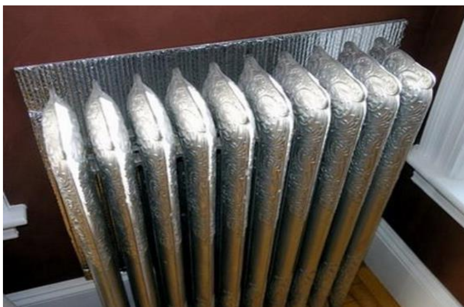
Рисунок. Пример установки теплоотражающего экрана

Для повышения эффективности теплоотдачи рекомендуется красить радиаторы в темный цвет, поскольку темная поверхность отдает на 5-10 % тепла больше.